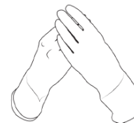
6) Pull the gloves up over the cuffs of the gown.