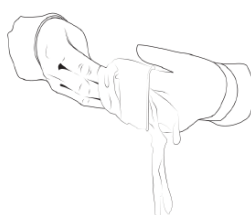
4) Insert the left, gloved hand into the cuff opening of the right glove.