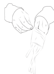
3) Holding the exposed inside cuff of the left glove with the right hand, put on the glove.