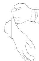
5) Pull the glove onto the right hand.